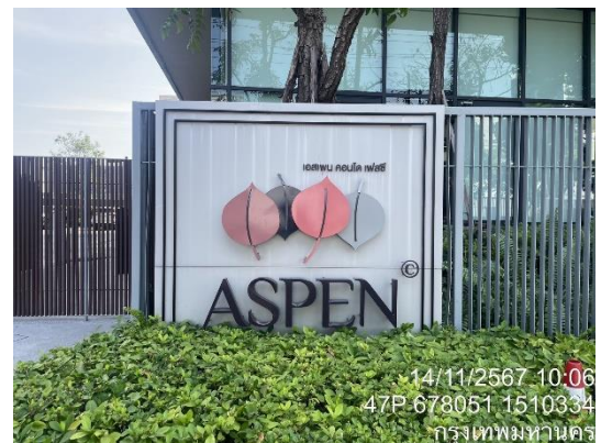
รูปที่ 1-1 สภาพภายในพื้นที่โครงการ